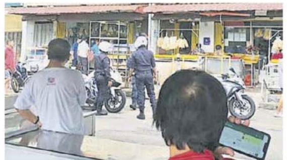
→警員向違規做生意的小販提出勸告。