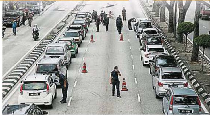
警方在敦李孝式路设路障, 检查来往车辆, 并劝告民众不要随意外出。

“警方目前仍以劝告方式, 提醒民众留在家中防疫, 但若民众随意外出的情况持续, 警方将