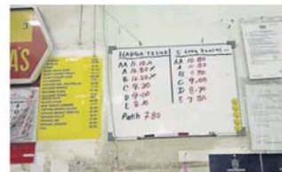
加影其中一间鸡蛋批发店的售表。