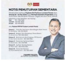
民主行動黨峇株巴轄區國會議員提供高達9組联系號碼，供選民在行動管制期間可联系。