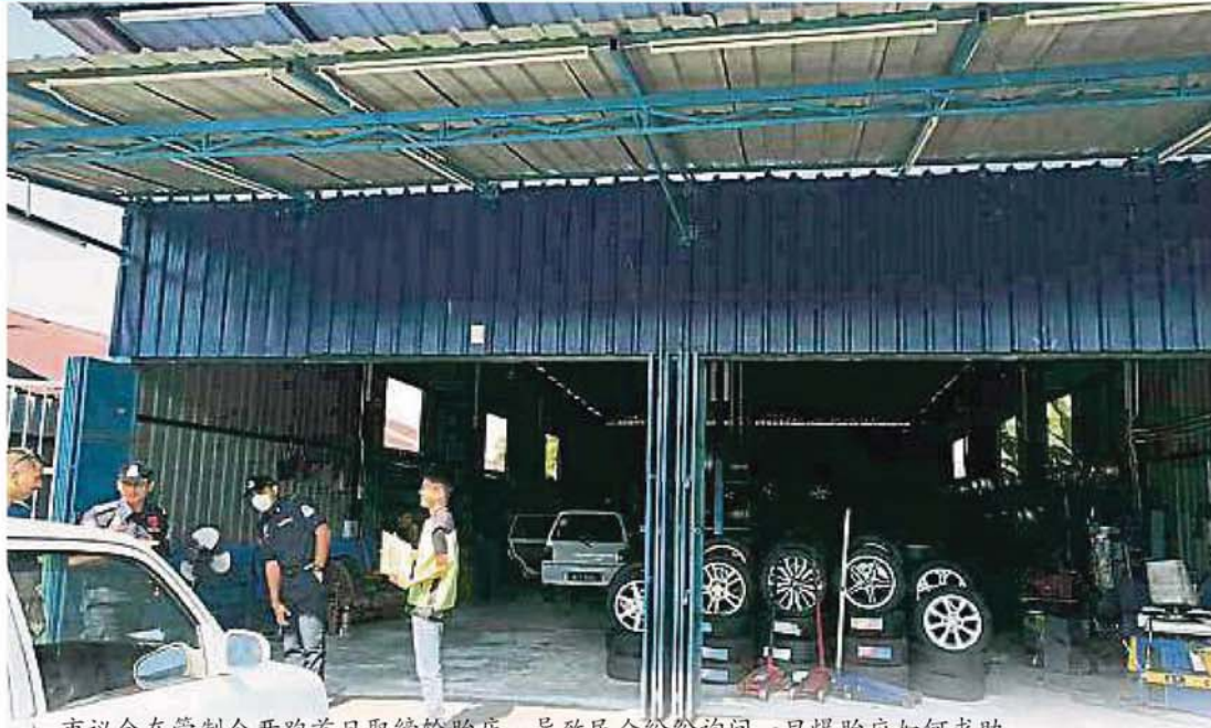
市议会在管制令开跑首日取缔轮胎店，导致民众纷纷询问一旦爆胎应如何求助。