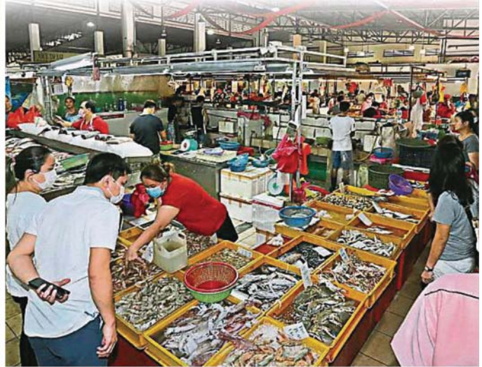
▲蒲种公主城Puteri Mart湿巴刹人潮依旧,大部分民众戴上口罩到巴刹购买食材。