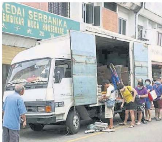
↑外來小販到太子園巴剎做生意，吸引購買人潮。

“警方也是有出來巡視和勸告，希望明天開始做到零商家和小販做生意，愛你的生命，愛你的家人，請暫停做生意。”