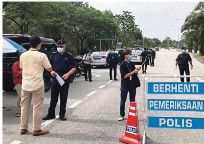
Subang Jaya police has set up roadblocks to make sure the public follow the movement control order.

dents who alert us about other people not following the order," she said.