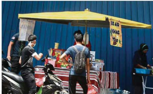
Some hawkers in Bandar Tasik Selatan operating their business despite the movement control order.