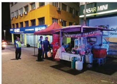
MPAJ officers advising stall operators to cease business in accordance to the MCO.