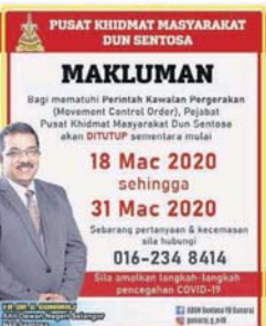
聖淘沙區州議員古納拉服務中心發出關閉的通告。