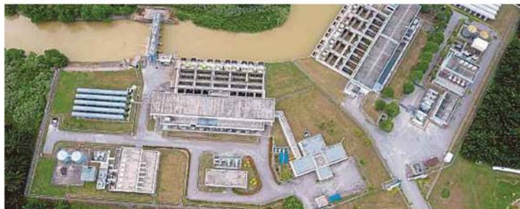
Loji Rawatan Air Sungai Selangor Fasa 2 antara yang terpaksa dihenti tugas pada malam Selasa lalu susulan pencemaran bau yang dikesan pada sumber air mentah di Sungai Selangor. (Foto hiasan)

saan JAS, termasuk pengeluaran kompaun bagi kesalahan yang membabitkan pengurusan buangan terjadual tertakluk dalam Peraturan-Peraturan Kualiti Alam Sekeliling (Buangan Terjadual) 2005 turut diambil.