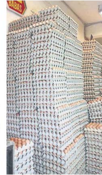
民众大量抢购鸡蛋以致鸡蛋不足而起价。