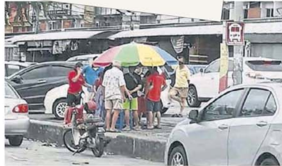
■路邊攤小販無視行動管制令，在路邊兜售食物。