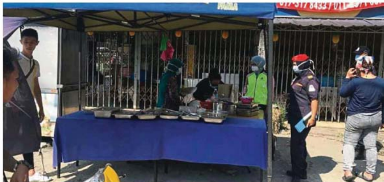
MPS enforcement officers on their rounds to warn roadside food stalls operating as usual in Selayang on the first day of movement control.

Local councils conduct checks to ensure hawkers, non-essential services obey movement control order