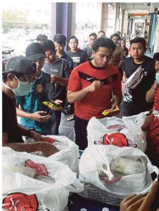
Pusat Khidmat Pelajar di Seksyen 7, Shah Alam mengagih bungkus makanan kepada pelajar UiTM, semalam.