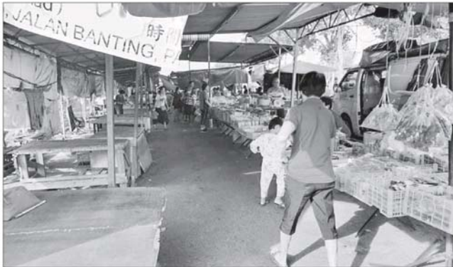
安州五安客去轉小目主 維班打巴新板路日市圖二目上法好去程以00%的小販照常營業