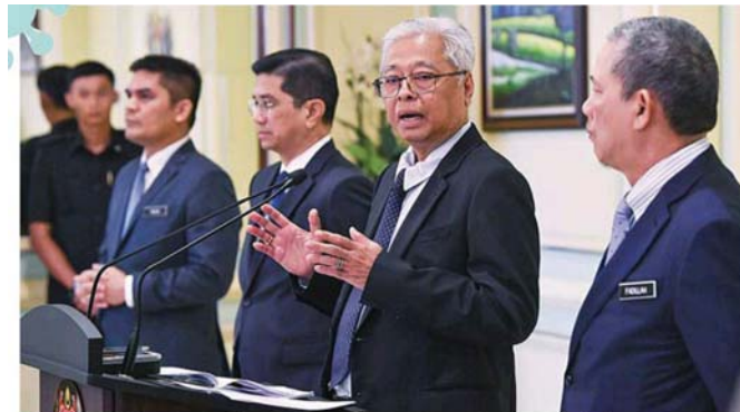
沙比里（右 2）主持行动管制令部长级特别委员会会议后召开新闻发布会，右起：工程部长拿督斯里法迪拉、贸工部长拿督斯里阿兹敏阿里及教育部长莫哈末拉兹。